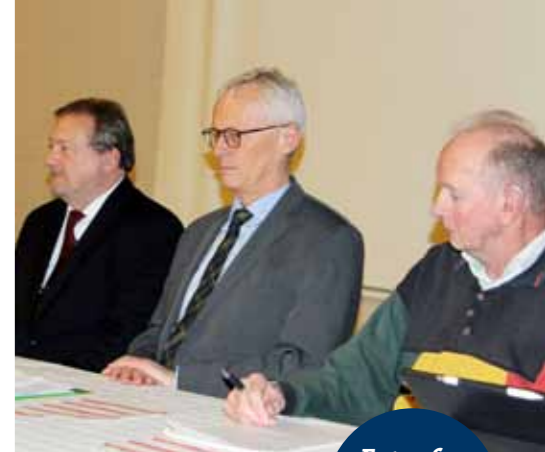
Fotos fra opstillingsmødet

vores tilbud om hjælp til et Italien – der havde et sundhedsvæsen helt i knæ – var og er ikke i orden. Disse ubrugelige respiratorer, som blev tilbudt på et tidspunkt – hvor vi burde have meget andet og meget mere at tilbyde – ja de vil nok blive husket længe i Italien. Hvor er socialisternes internationale solidaritet henne – når det virkelig gælder? Her må vi som liberale gå i front!